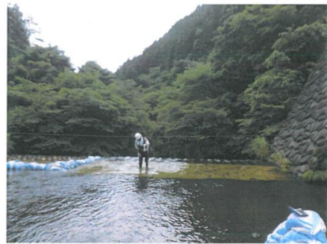
河川流量観測の様子