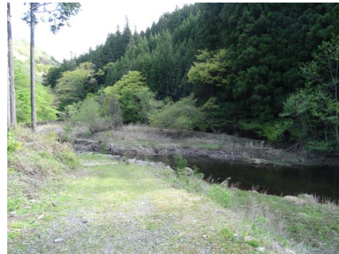
取水設備設置場所 (案)