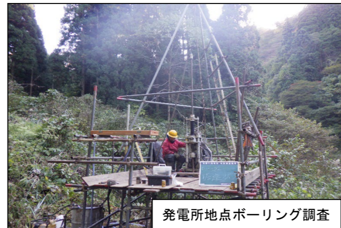
発電所地点ボーリング調査