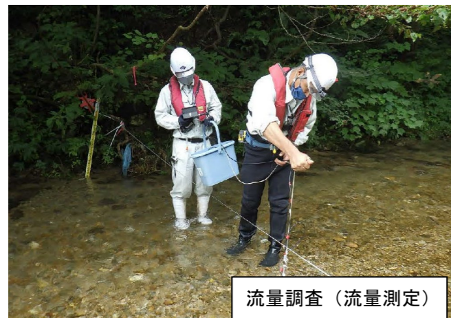
流量調査（流量測定）