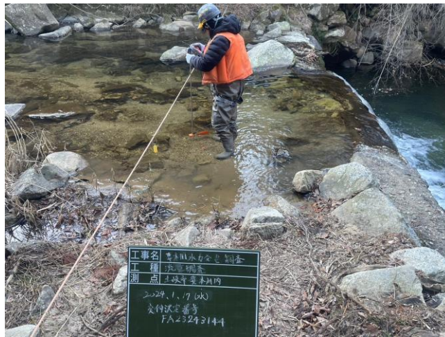
流速計を使用して河川水量を計測

2023年11月より補助対象内調査(外注)を開始し、2024年2月初旬で終える。流速計を用いて観測を行い、水力発電所に於ける取水量の推計を行う。実質的には4カ月に満たない期間である為、更に流量観測を進めて、2024年10月まで観測を継続し、確度の高い取水量の推計を実施する。