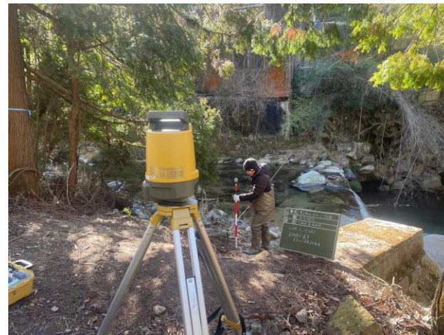
測量機を使用して河川の横断図を製作