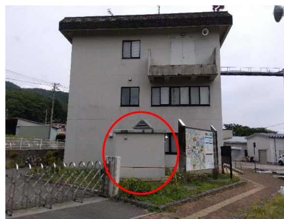
既設屋外トイレ（撤去前）

令和7年度は、大規模改修工事で撤去した水車発電機をモニュメント化し、美和ダム敷地内に展示する。また、機器の仕組み等を解説する説明看板の製作・据付を行う。