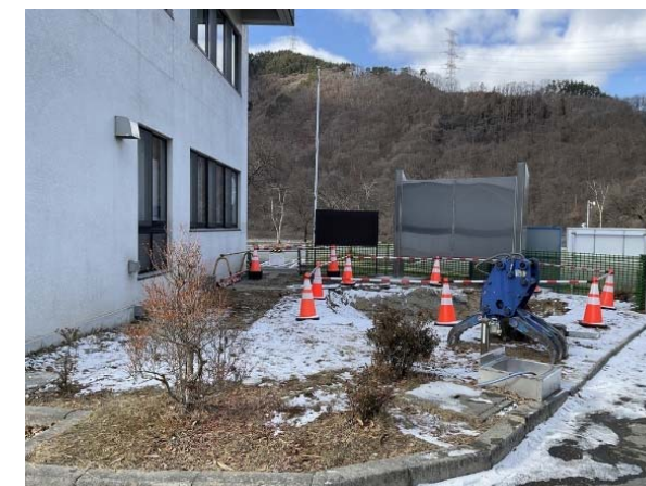
屋外トイレ撤去完了