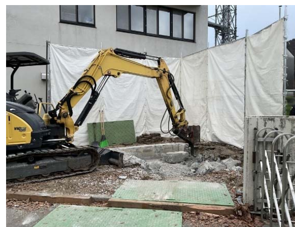
屋外トイレ撤去状況