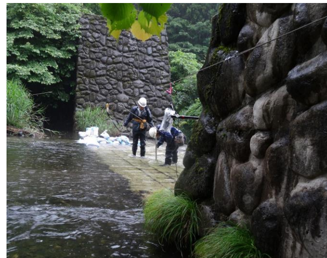
河川流量調査の様子