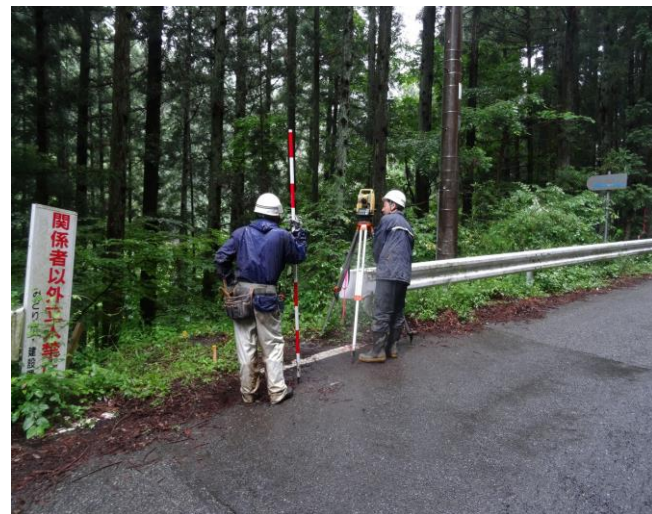
簡易測量調査の様子