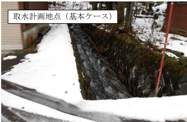
取水計画地点 (基本ケース)