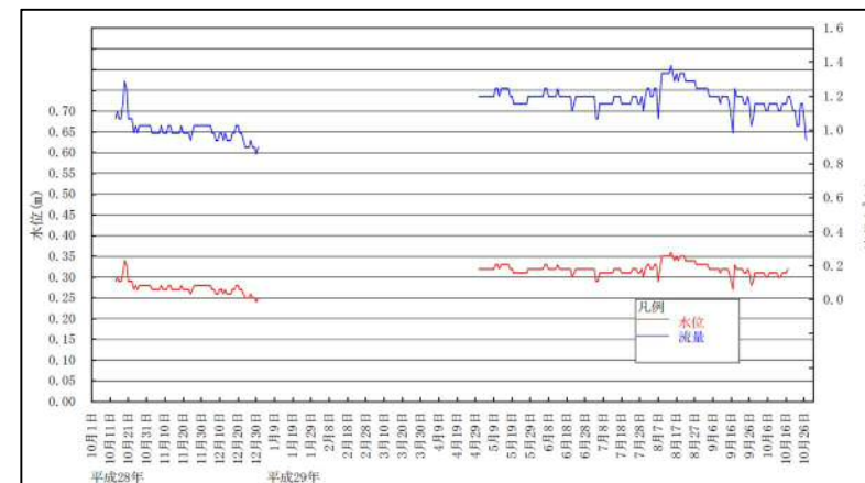
H28~29 年度流量調査結果

流量調査・地形測量・地質調査により得られたデータにより、最適規模の発電計画とその図面が得られた。