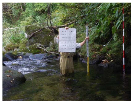
正常流量調査実施状況