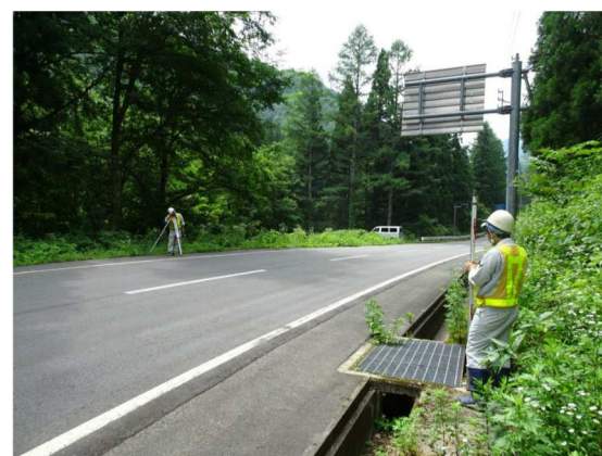
測量調査実施状況