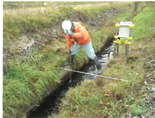
平成 30 年度 流量調査状況

水位測定 : 平成 30 年 11 月～平成 31 年 1 月 流量調査 : 4 回