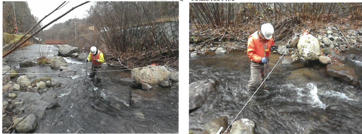
平成 30 年度 流量調査状況

流量調査を平成 30 年 11 月～平成 31 年 1 月にかけて実施 流量調査 : 6 回