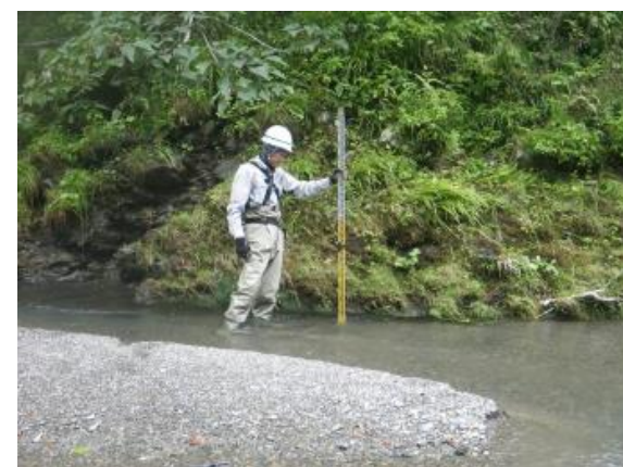
測量調査 河川縦横断測量