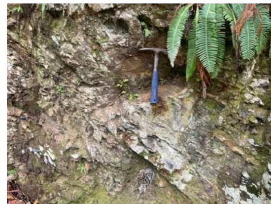
地質調査 現地調査