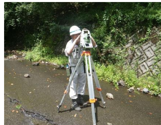
測量調査 4級基準点測量