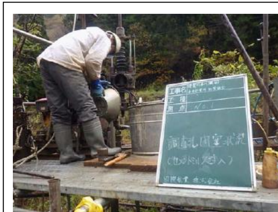
地質調査 調査孔閉塞