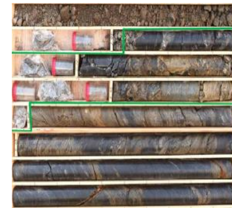
コア写真 (地質調査)