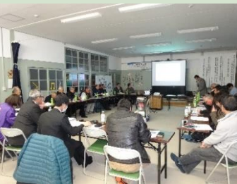
地域理解促進(勉強会)