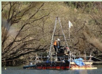
地域環境整備(調査)