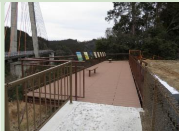
地域環境整備(設備)