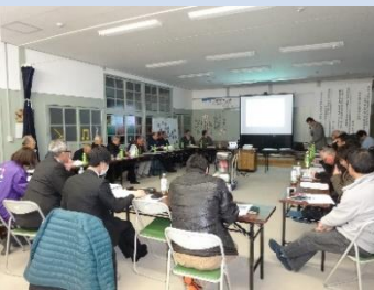
地域住民との勉強会