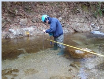
地域環境整備（調査）